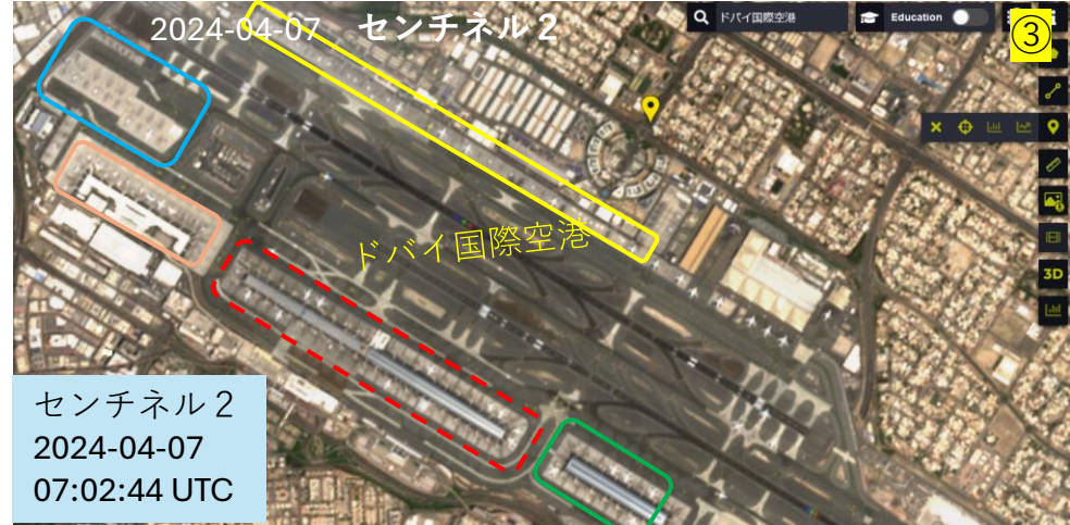
センチネル2 2024-04-07 07:02:44 UTC

ドバイの国際空港では24時間雨量が150mmを超え（中略）、この地域は雨が少なく、平年の年間雨量が100mmに満たないような所がほとんどです。今回の大雨では1年分を大きく超えるような雨が、わずか24時間で降ったこととなります。（以下略） https://weathernews.jp/s/topics/202404/170075/ ②