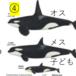
④ オス メス 子ども

https://www.kahaku.go.jp/research/db/zoology/mamm/pictorial_book/o_orca.html