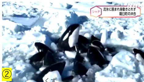
シャチ 流水に囲まれ身動きとれず 羅臼町の沖合