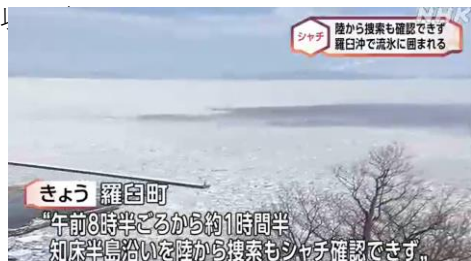
シャチ 陸から捜索も確認できず 羅臼沖で流水に囲まれる

https://www3.nhk.or.jp/sapporo-news/20240206/7000064672.html