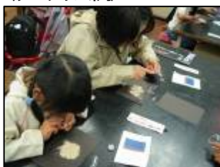
▲星砂で星座絵をかたどる工作