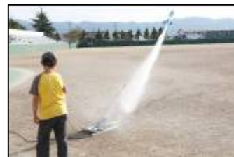
▲水ロケットの実験