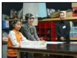
▲アルコールロケットの実験