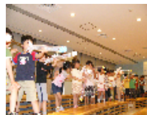
▲かさ袋ロケットの実験