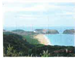
種子島宇宙セン ター(打ち上げ場)