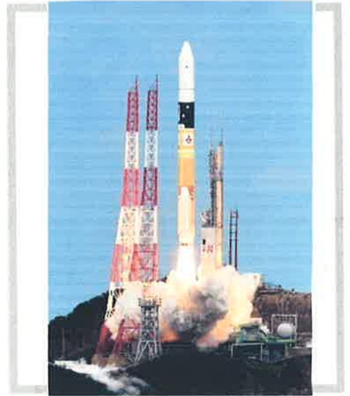
▲ 打ち上がった時の画像

私が種子島に上陸したのは二回目です。一回目はいまわりの8号の打ち上げです。今回は「はやぶさ2」が宇宙好きのきっかけだったのには、まさの後継機「はやぶさ2」の打ち上げはぜひ見たいなと思ち上げたし、残念な感じが、打ち上げは私達が帰った後の12月3日にはできず、見ることができず、種子島の観光に行きたが、種子島の冬は、いまや雨の多い季節で、強風や雨の延期はかみなりです。