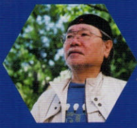
公益財団法人日本宇宙少年団 理事長 松本 零士

無限の宇宙の中の地球という星の上で、わたしたちは出会うことができました。この出会いを大切にYACで楽しく宇宙や科学を体験し、新たなる冒険者になりませんか？ 夢をもってチャレンジしていきましょう。