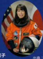
YACアドバイザー 宇宙飛行士 山崎 直子

無限の宇宙の中の地球という星の上で、わたしたちは出会うことができました。この出会いを大切にYACで楽しく宇宙や科学を体験し、新たなる冒険者になりませんか？ 夢をもってチャレンジしていきましょう。