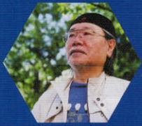
公益財団法人日本宇宙少年団 理事長 松本 零士

無限の宇宙の中の地球という星の上で、わたしたちは出会うことができました。 この出会いを大切にYACで楽しく宇宙や科学を体験し、新たなる冒険者になりませんか？ 夢をもってチャレンジしていきましょう。