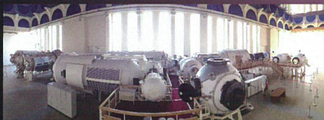
ミール宇宙ステーションモックアップレクチャー&実習