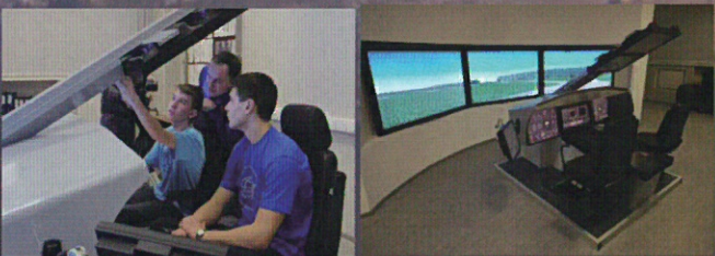
航空機/ヘリコプター操縦シミュレーター体験