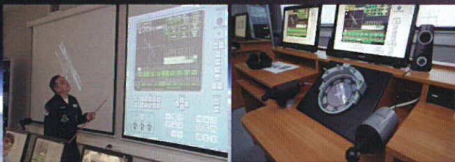
ソユーズ宇宙船ドッキングレクチャー&シミュレーション体験