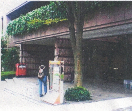
<切手の博物館>入口