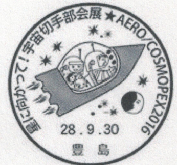
記念小型印の申請原図