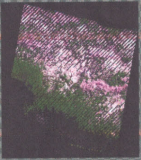
8号バツF4 2014/1/07 ランクサット8号バツF5 2014/1/07 ランクサット8号バツF3 201...

編集(B) 表示(O) 解除(A) 出力(P) オブジェクト(O) ヘルプ(H) 色合成 保存(X) 開じる 色・明るさ 色わけ 切り出し 計算 出力・ 縮尺 凡例 並べる 運動 縮小 拡大 2.5%